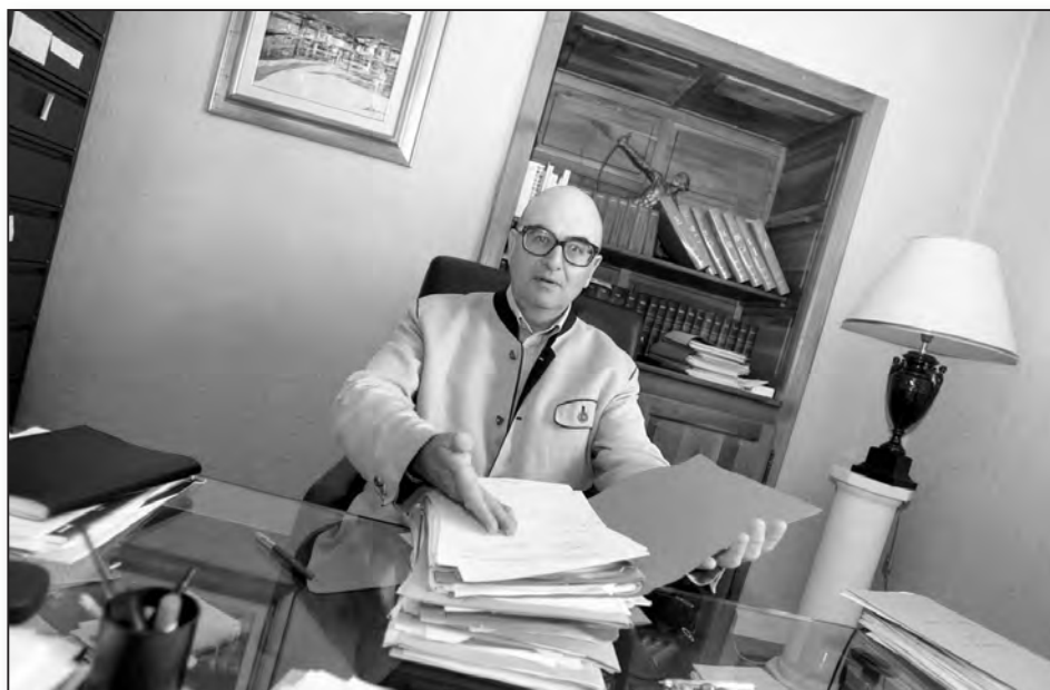
Face à la problématique foncière, l'avocat défend la solution du remembrement

Dans le prochain volet de ce dossier nous aborderons le remembrement et les moyens afférents de constitution des titres de propriété ■