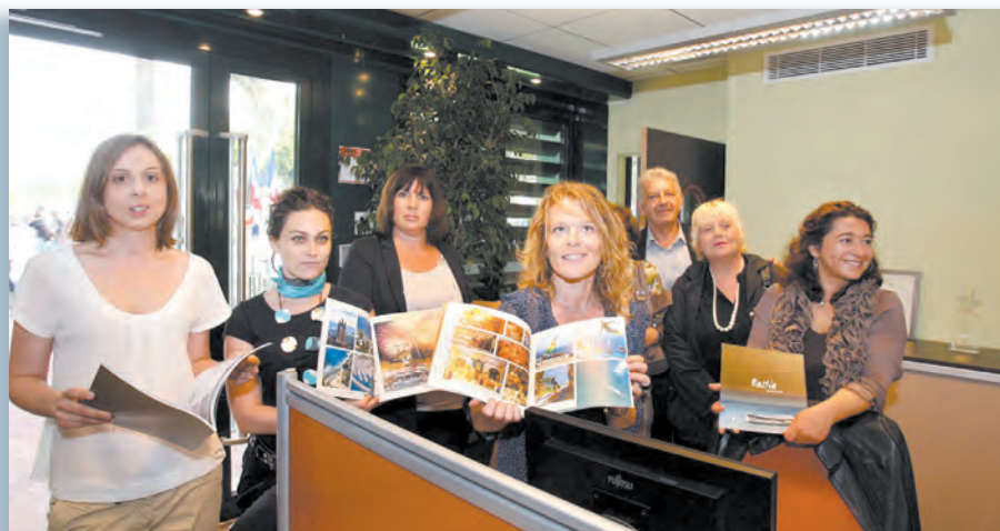
L'équipe de l'OT dans ses nouveaux murs et dans les starting blocks