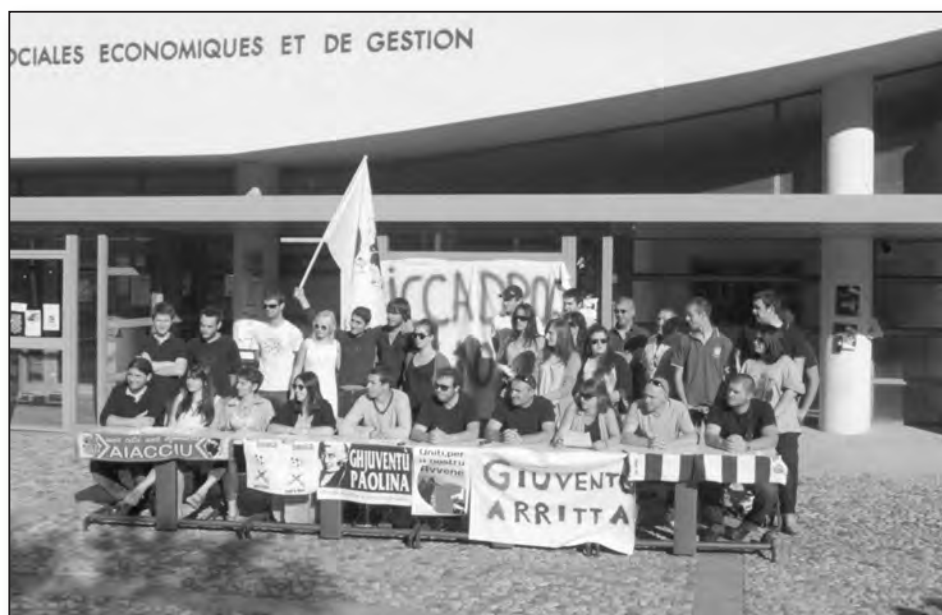
De nombreux étudiants investis dans le cadre du Collectif "Micca droga ind'è noi", en ordre de marche

Le reste est l'affaire des artisans, qui offrent du goût, de la tradition et de l'originalité à la promenade, sans oublier le cabaret San Brancà où le chant corse fait la part belle aux amateurs. Côté scène, l'Arcusgi, et Ochju à ochju ont donné le la culturel à Saint Pancraziu ■