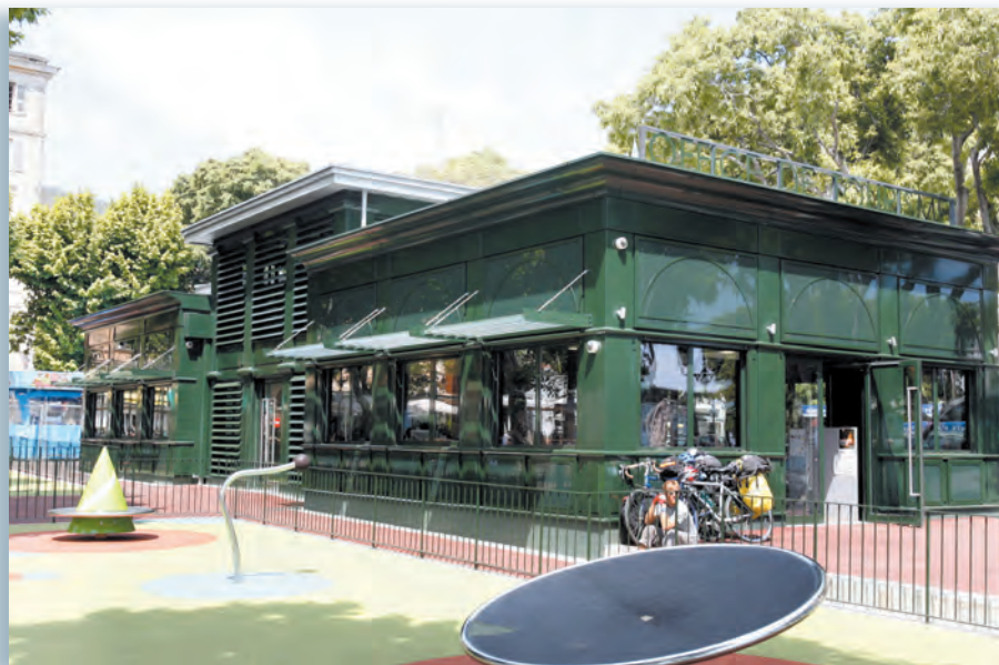
La construction tout de verre et d'acier dessinée par l'atelier Archimed