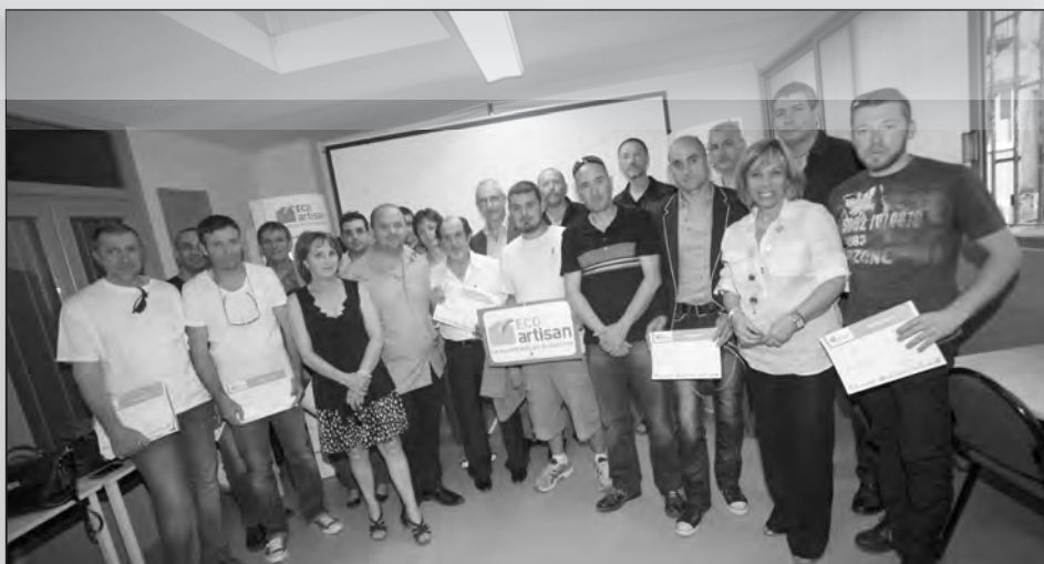
Ces premiers Ecoartisans de Haute-Corse qui font dans l'économie d'énergie mais pas de savoir-faire

Le 17 mai, dans les locaux de la Chambre des Métiers de Haute-Corse, 15 entreprises insulaires représentant tous les corps d'état du bâtiment (plombiers, maçons, plaquistes, électriciens, menuisiers...) se sont vu remettre par la CAPEB de Haute-Corse leur label d'Ecoartisan. Une plus-value pour leur activité qui, tout en leur permettant de se distinguer, vient honorer leur implication en matière de respect de l'environnement via l'amélioration de la performance thermique des logements sur lesquels ils interviennent.