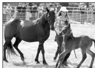
L'associu Cavallu corsu a présentu le premières pouliches de la race

L'édition 2011 de la traditionnelle "Fiera di San Brancà" s'est imposée comme l'événement printanier de la Casinca, à travers un programme varié "trà canti è tradizioni".