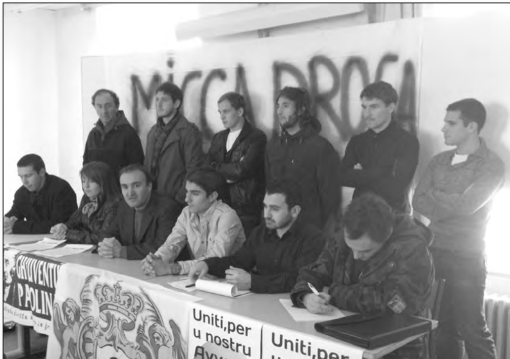
Conférence de presse du Collectif "Micca droga ind'è noi", dernièrement à Corte

Au cours de ces derniers mois, de nombreux insulaires sont montés au créneau pour faire entendre, d'une même voix, leurs inquiétudes quant à la banalisation de la drogue au sein de la société corse. Des femmes et des hommes, d'horizons divers, ont ainsi décidé de changer la donne et de lutter efficacement contre ce fléau majeur. Un ensemble d'actions a d'ores-et-déjà été déployé. Comme nous l'ont expliqué les représentants du Collectif «Micca droga ind'è noi» dont la dernière réunion d'information a récemment eu lieu à Corte.