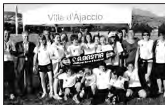
L'équipe du CAB

Et si les résultats du premier Tour n'ont pas été à la hauteur des espérances, les « Rouges et Verts » entendent tout mettre en œuvre pour prouver que leur place était bien à Miramas tout en espérant mieux pour l'avenir !