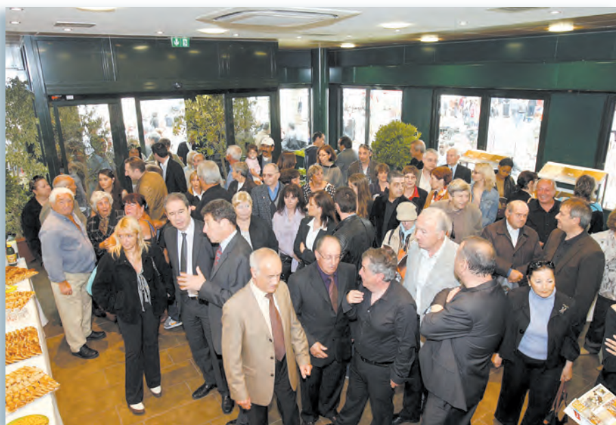
Du beau monde pour une inauguration attendue, au coeur du bâtiment vert